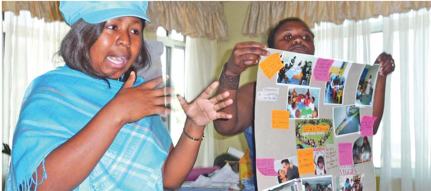
Youth2Youth: Jugendliche präsentieren ihre selbst aufgebauten Projekte.