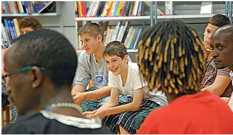
Austausch in Binningen: Jugendliche aus Nairobi schildern einer Klasse, wie sie Gewalt erleben.