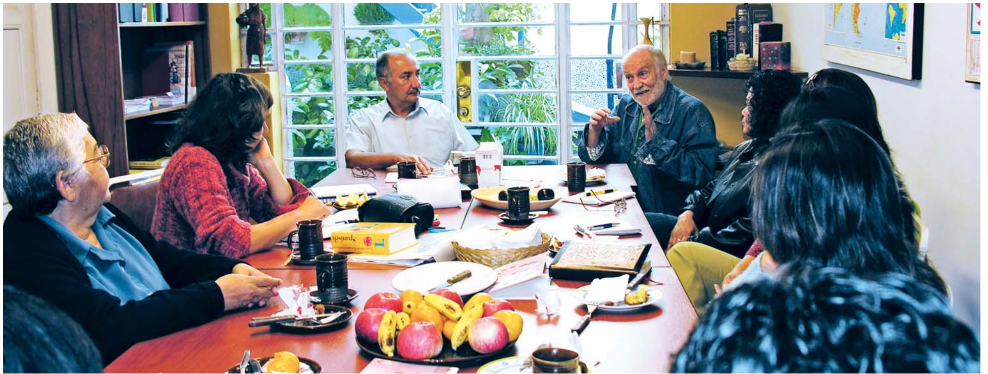
Aufgebrachte PartnerInnen: Die peruanische Regierung ignoriert Missstände.